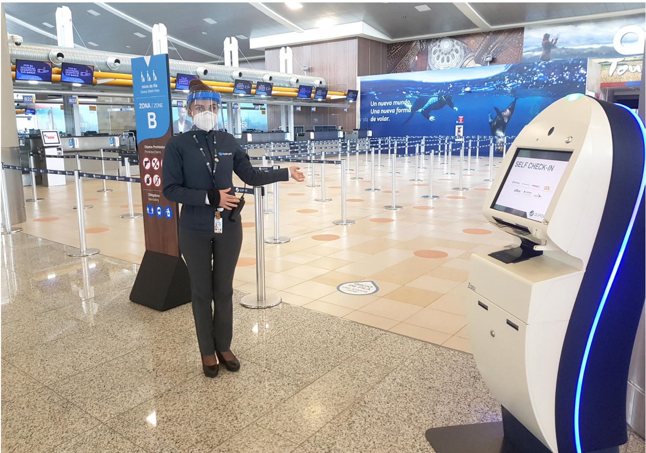
El trabajo del personal de Quiport ha sido fundamental para la adecuada atención a los pasajeros en esta 'nueva normalidad'.

“El adecuado uso de las medidas de protección sanitaria en la terminal aérea y la aplicación de protocolos de bioseguridad han contribuido a la recuperación de la confianza de los pasajeros en el transporte aéreo. La confianza no se gana de un momento a otro; es un proceso que requiere disciplina y tiempo y el aeropuerto de Quito le ha ganado tiempo al tiempo y ya ha avanzado en este proceso” explica Andrew O’Brian, Presidente y Director General de Corporación Quiport, empresa a cargo de administrar, operar y mantener el aeropuerto de Quito.